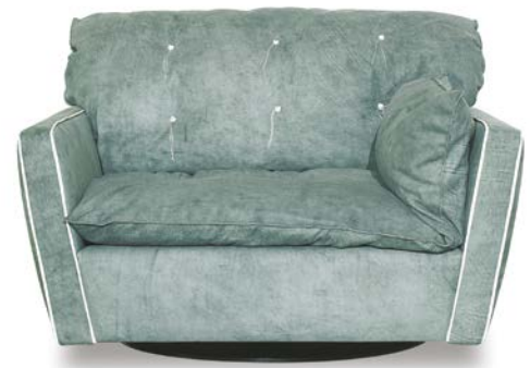
Bo.Hemian Nympha | p. Extra Opal

Struttura in multistrato fenolico ed essenza di abete. Imbottitura in poliuretano espanso a densità differenziata con rivestimento in fibra acrilica.