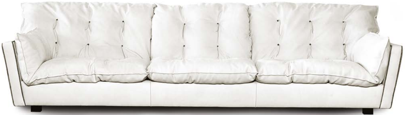
307 x 105 | Extra Opal | p. Bo.Hemian Siberia