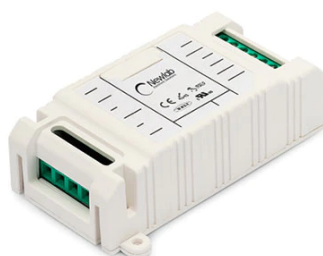
RF26994 Dimmer Led