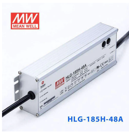
RF29209 HLG – 185H – 48A